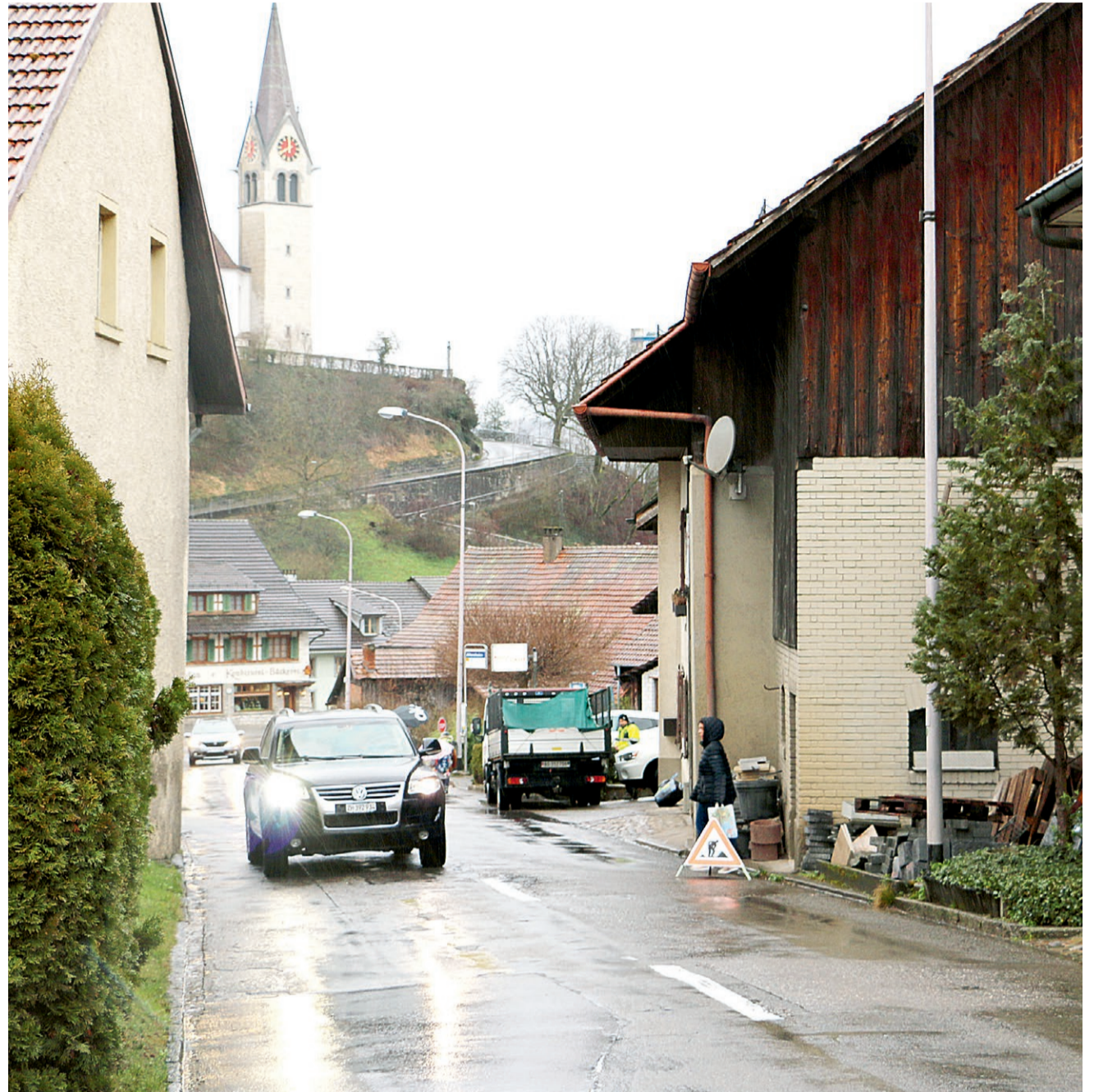
Die Engstelle oberhalb der Bushaltestelle Altersheim.